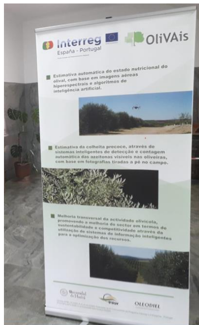
Figura 2.8: Carteles y roll ups ubicados