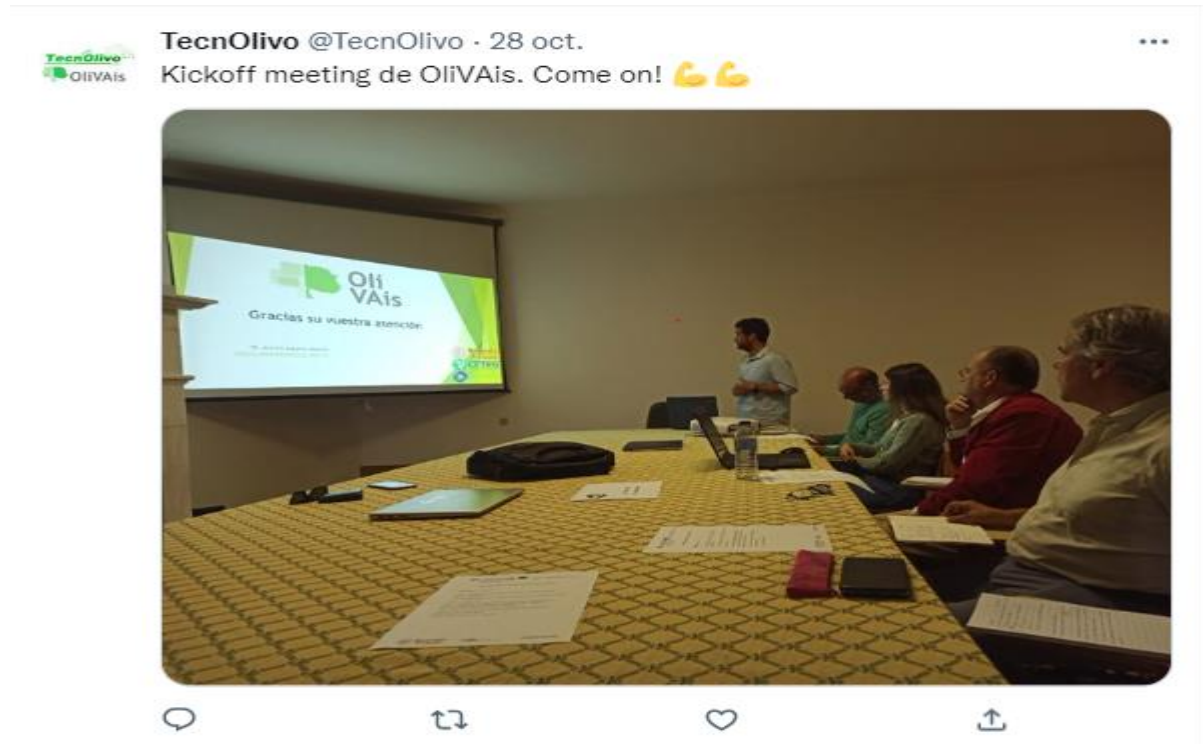
Figura 2.6: Tweet nº 1

A través de la red social de Twitter se dará una mayor visibilidad del proyecto publicando contenido propio correspondiente a la ejecución y al avance del mismo. Seguidamente se adjunta capturas de algunos tweets ya publicados: