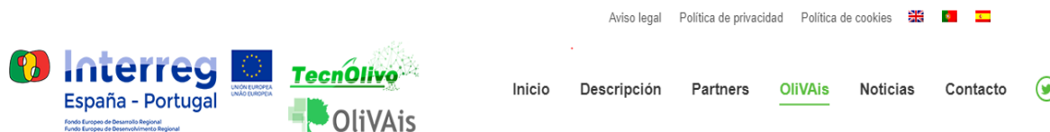
Figura2.4: Encabezado de la web de OliVAis