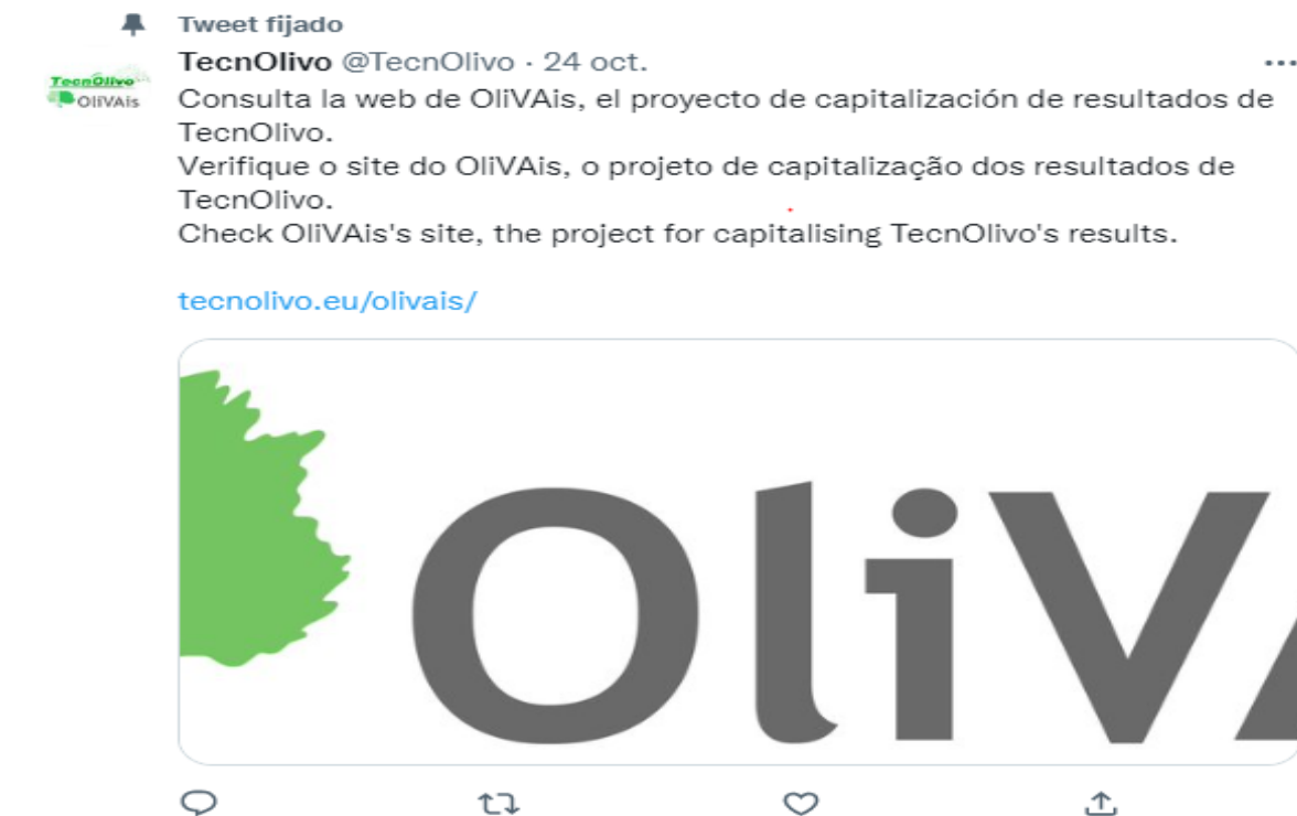
Figura 2.7: Tweet nº 2