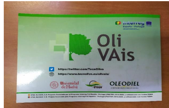
Figura 2.9: Libro impreso del proyecto OliVAis