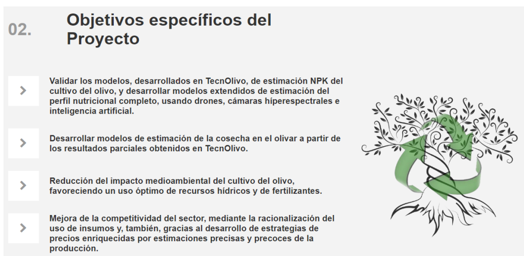
Figura 2.1: Apartado de objetivos del proyecto presente en la página web de OliVAis.