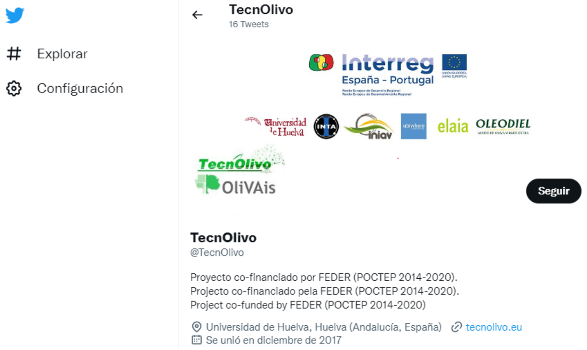
Figura 2.5: Cuenta de twitter del proyecto TecnOlivo y OliVAis